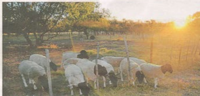
Ian har förutom sina femtio får, sjuhundra kalvar och kor för köttproduktion och ett sextiotal mjölkkor.