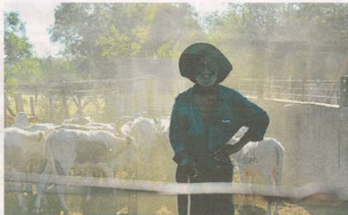
Boskapskötarens Neck, 79 år, har arbetat på farmen sedan 1962.